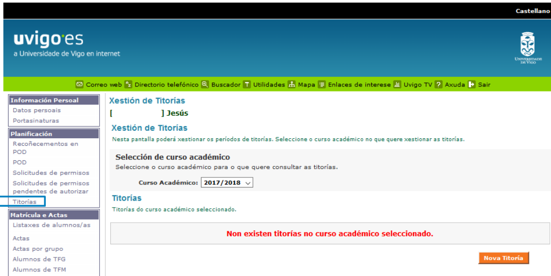
Ilustración 1 Acceso o módulo de titorías

A continuación amósanse as pantallas de Xescampus que interveñen a hora da xestión dos horarios de titorías.